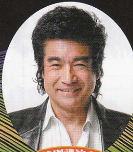
特別講演会 藤岡 弘、