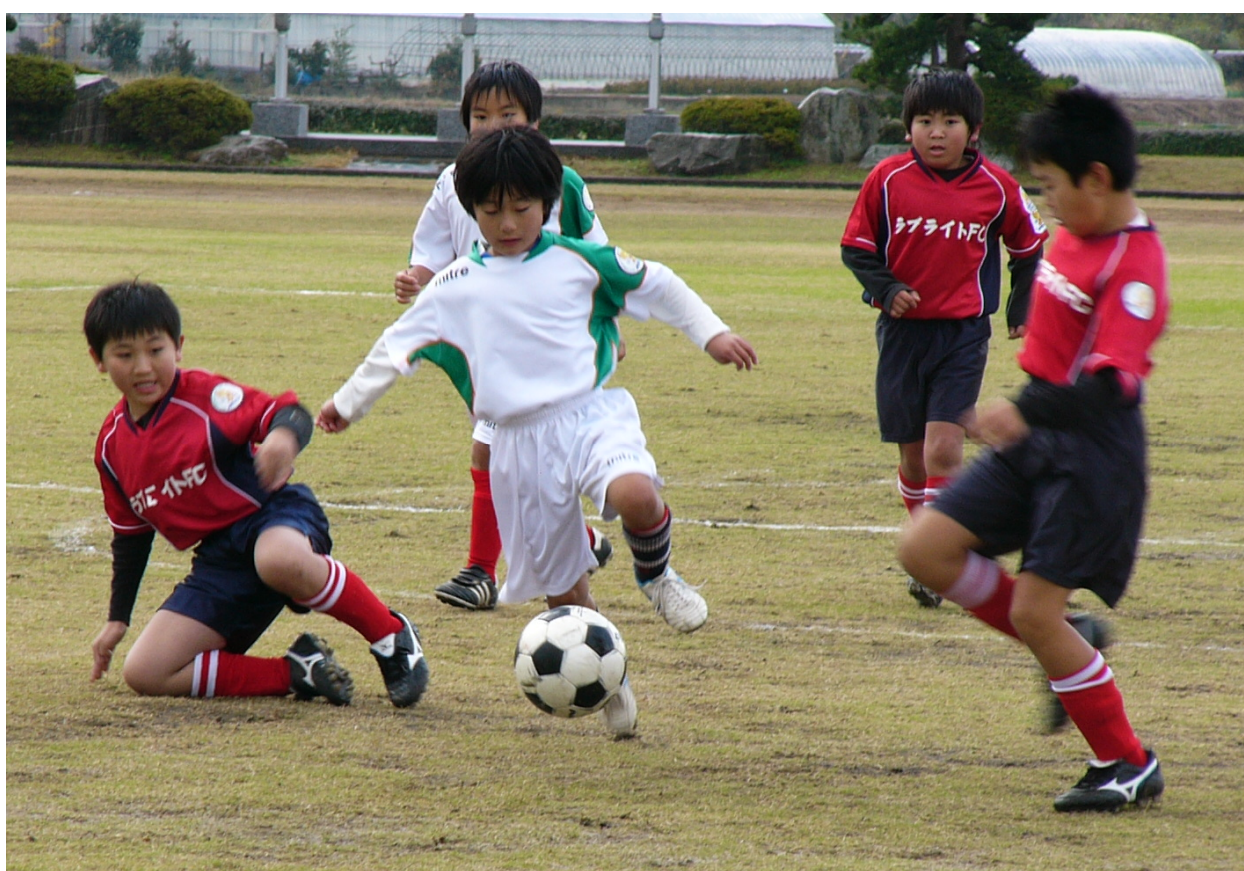
【H 2 1 . 1 2 . 5 第3回大会より】