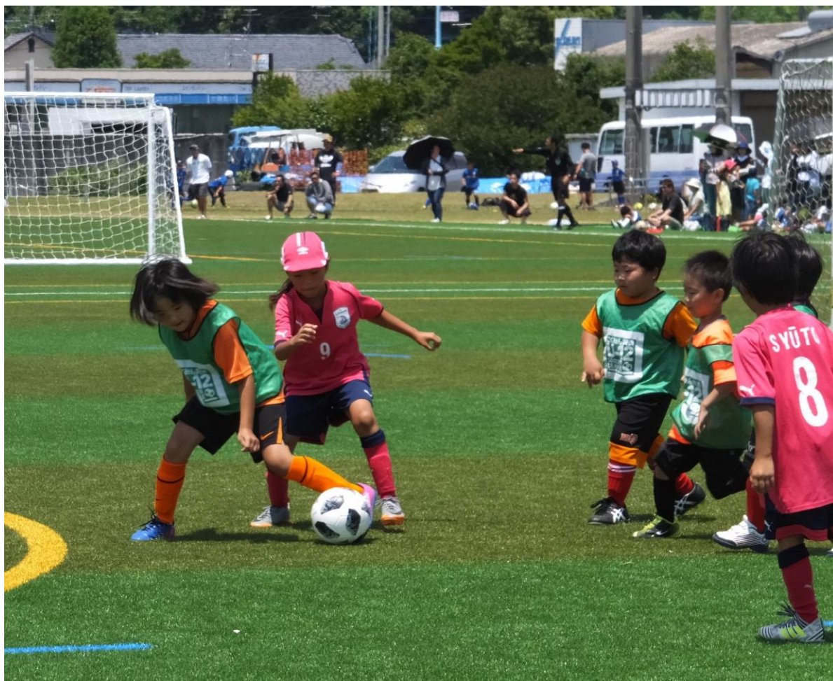
【H30.6.3 第13回あまくさ村カップより】